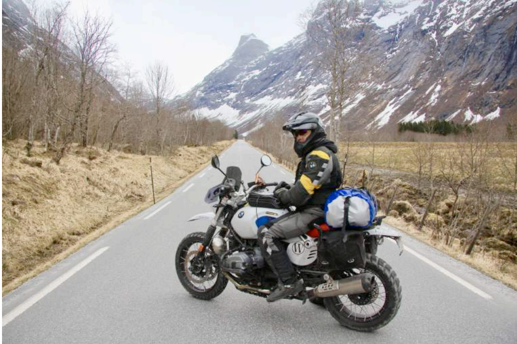
Ilustración 7. Noruega . Miquel sobre Etérea por una carretera rural