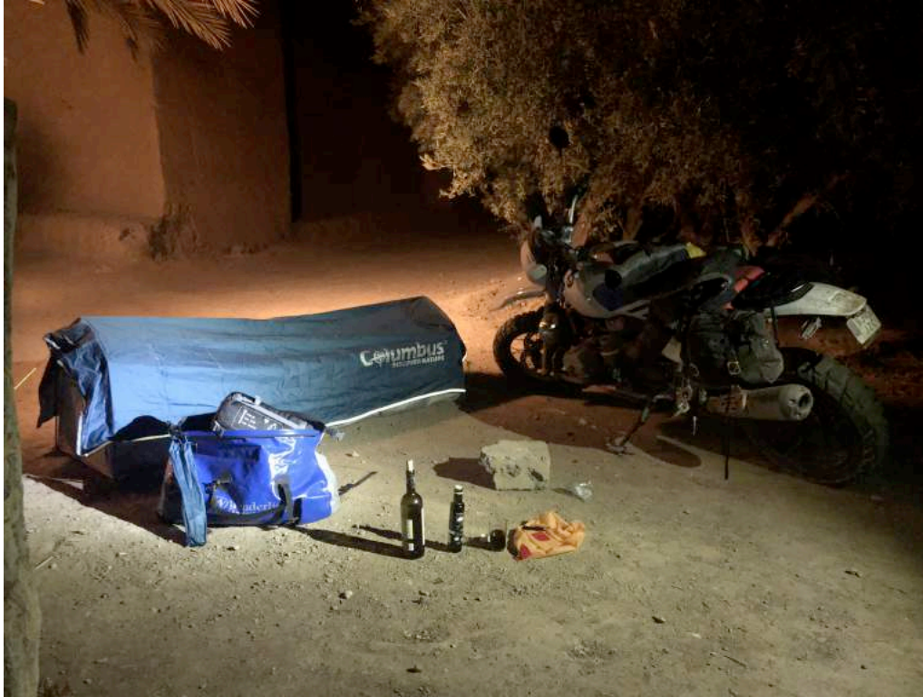
Ilustración 3. Skoura . Acampada en la Kasbah Ait Abou