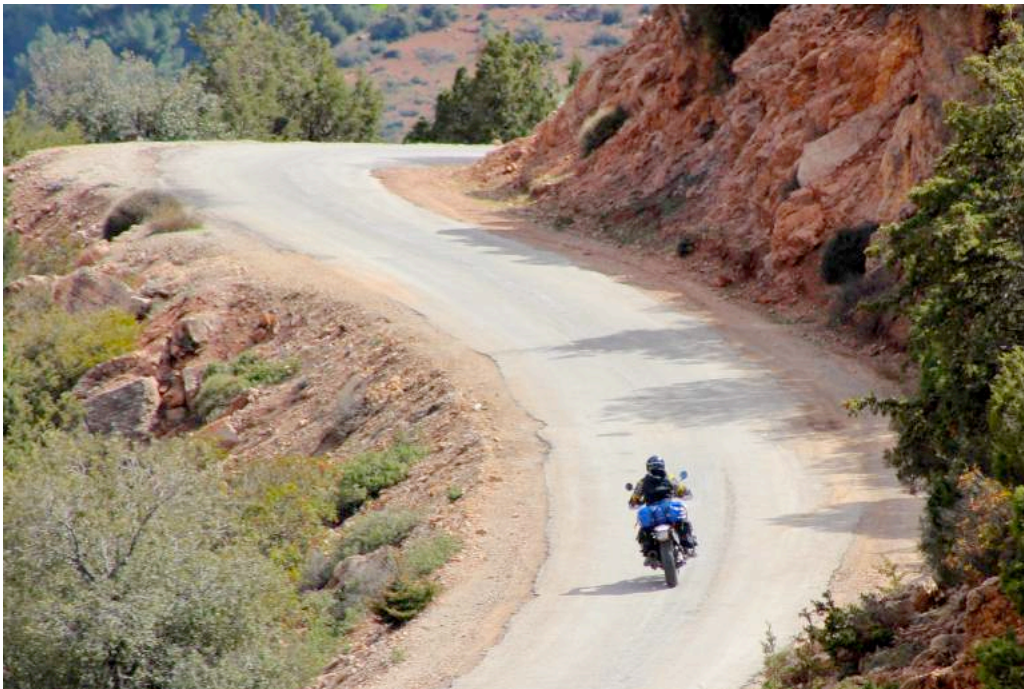
Ilustración 4. Agouadar . Miquel sobre Etérea