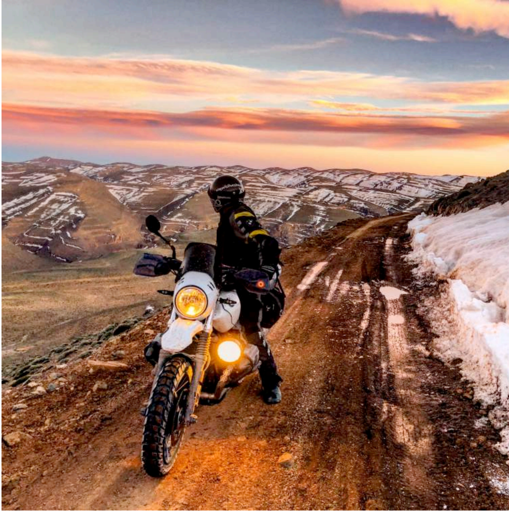
Ilustración 5. Skoura . Miquel en la cima del Atlas