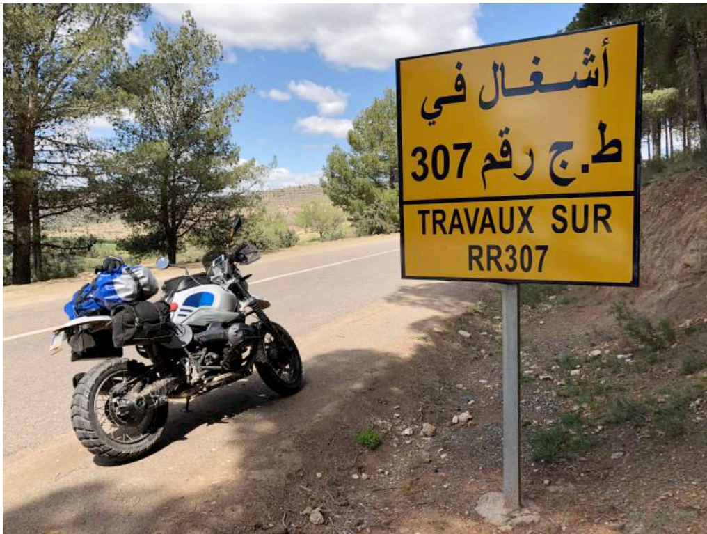
Ilustración 2. Demnat . Etérea en la R307