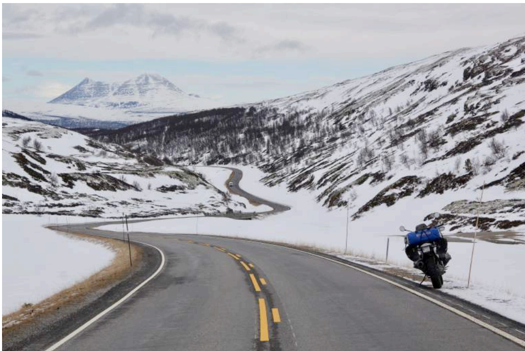
Ilustración 8. Noruega . Etérea de camino a Cabo Norte