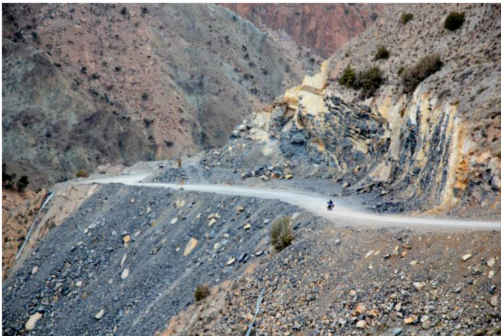
Ilustración 6. Skoura . Gargantas de Dadès