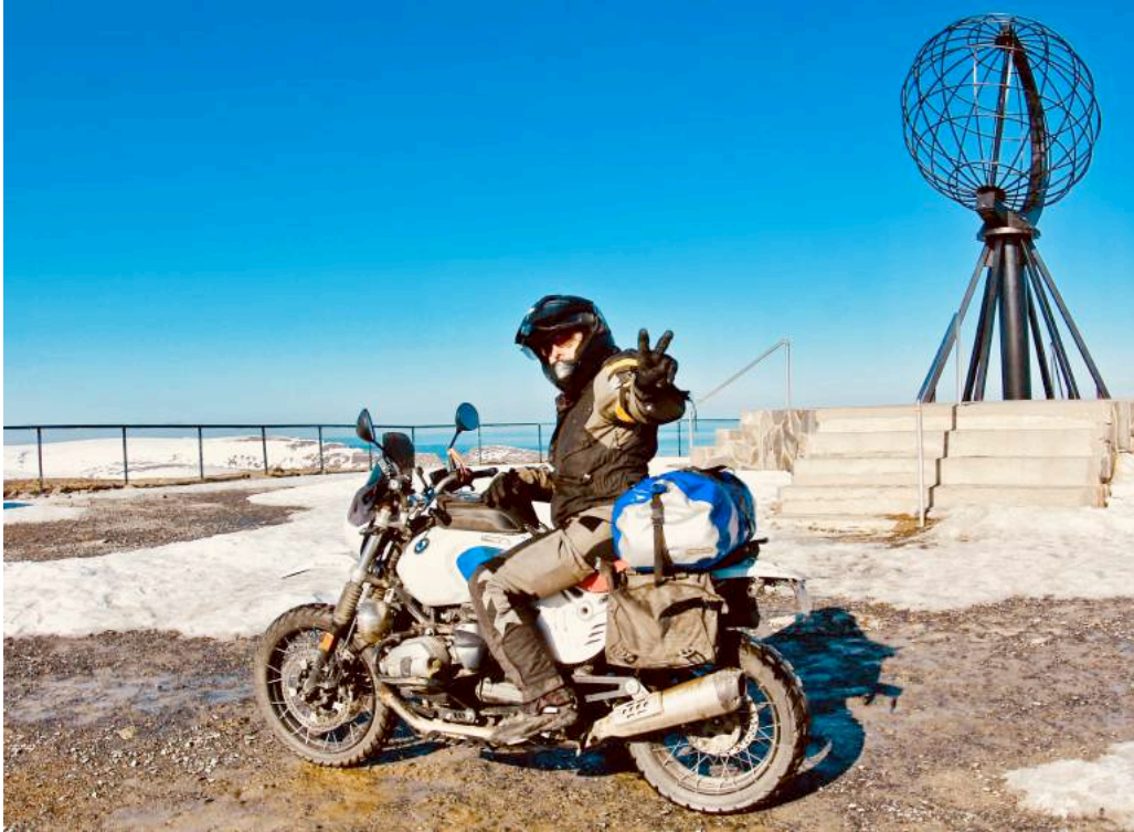
Ilustración 9. Cabo Norte . Miquel celebra el final de su viaje