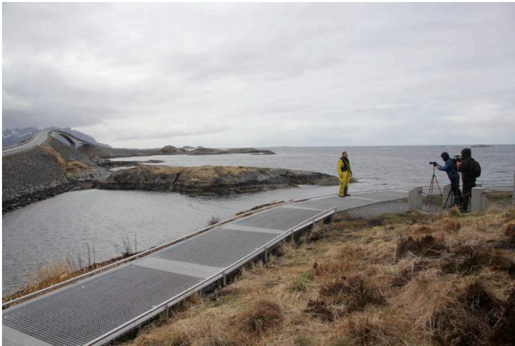
Ilustración 10. Noruega . Miquel y el equipo de grabación cerca de la Carretera del Océano Atlántico